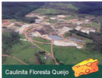
Caulinita Floresta Queijo