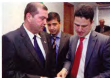
Ações junto ao governo pelo setor

de disseminação do produto cerâmico, a campanha "A Casa da Minha Vida", produzida pela Anicer, tem como público-alvo o consumidor final, além de arquitetos, engenheiros e profissionais da construção civil. Seu objetivo é a valorização da cerâmica como um produto ao alcance de todos. Com o slogan "Na casa da minha vida, só cerâmica", o trabalho ganha destaque em ações nas mídias digitais e redes sociais e promove a ACV dos produtos cerâmicos.