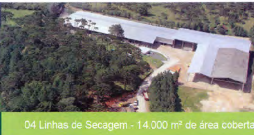
04 Linhas de Secagem - 14.000 m 2 de área coberta